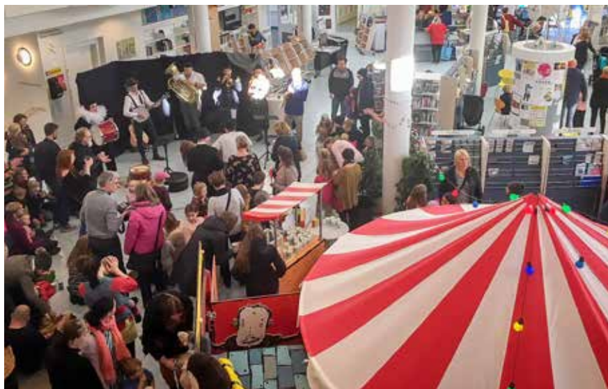
Invigningen firades med musik och cirkuskonster.