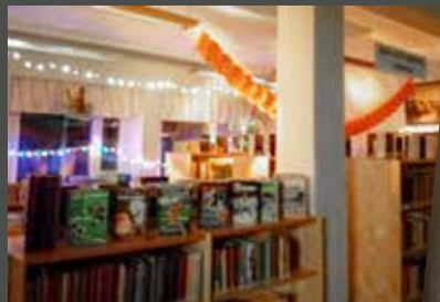
Spöklikt mysiga stämningar från biblioteken i Korsholm, Närpes och Överesse.