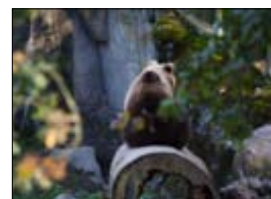
Björnarna på björnberget är välbesökta. Just nu äter björnarna upp sig innan de snart går i vinteride.

● 2011: Skansen fyller 120 år. Firas med 1 kronas inträde.