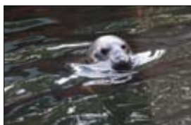
Sälarnas område byggs ut.