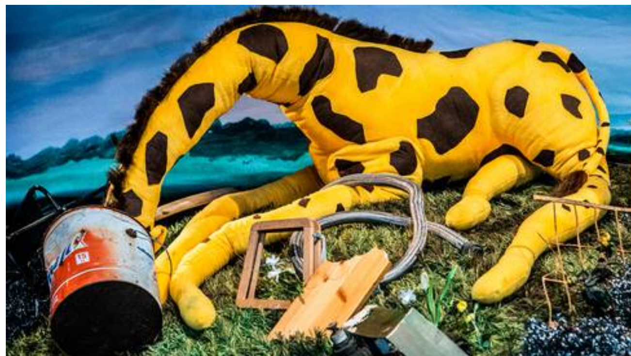
⊕ Den sänggätande giraffen.