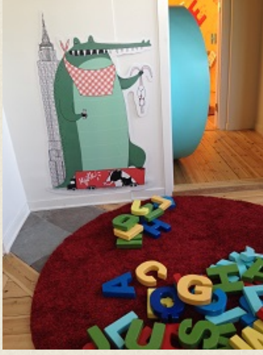
Hugo på plats